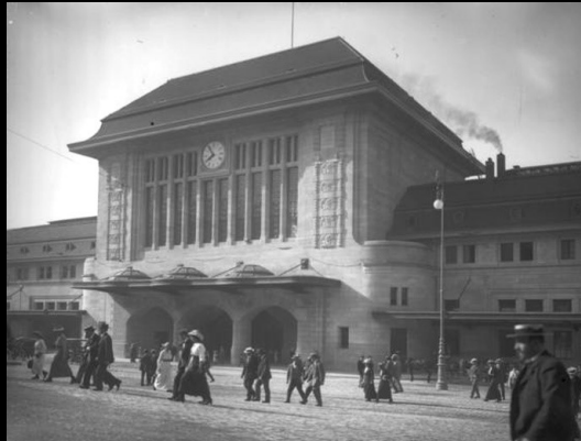
Gare de Lausanne, 1908-1916