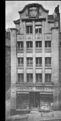
Librairie Payot, 1913