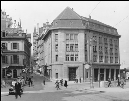
Banque Fédérale, 1910