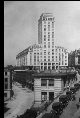
Bel-Air Métropole, 1932