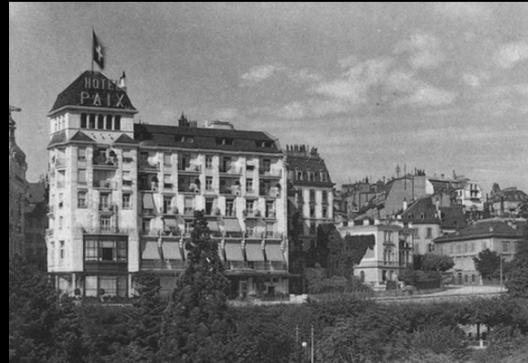
Hôtel de la Paix, 1910