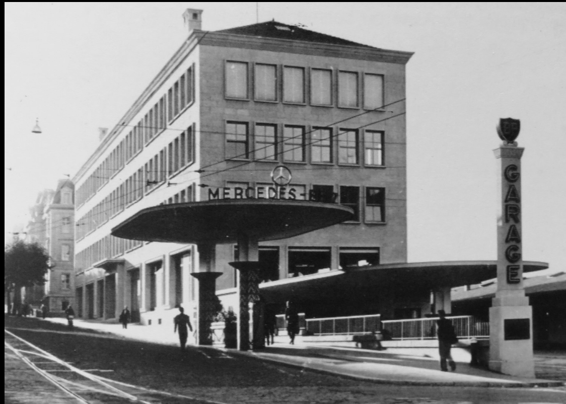
Le bâtiment av. de la Gare 45 juste après sa réalisation.