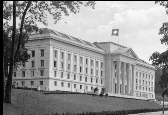
Tribunal Fédéral, 1922-1927